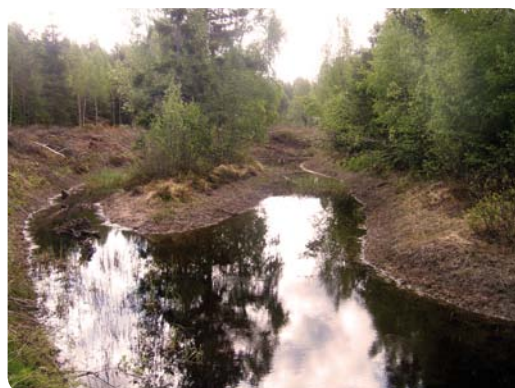
Grävda dammar kan bli produktiva kräftfiskevatten. En kräftdam i Kronobergs län.

Föreningarna kan sälja speciella fiskekort för kräftfisket, vilket är både lönsamt och efterfrågat. Priserna för kräftfiskekort skiljer sig beroende på var man fiskar. Från ett par hundralappar upp till en tusenlapp, brukar det kosta att fiska en natt med 10 burar. Då intresset för att fiska kräftor är stort, förstår man snabbt att