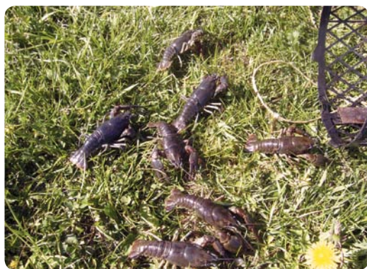
Öland är utpekad som skyddsområde för flodkräfta. Arten har minskat kraftigt och klassas numera som akut hotad.

Kräftor kan leva i många typer av vatten, men det finns några specifika krav. Kräftan är beroende av kalkrikt vatten